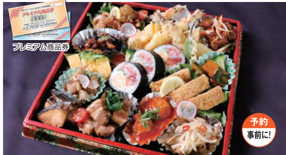
家族団らんセット 2,030円(税込)