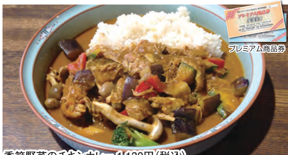
季節野菜のチキンカレー 1,130円(税込) ※ハーフサイズは730円(税込)