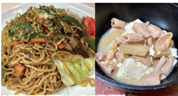
やきそば 750円(税込)、もつ煮 350円(税込) 事前連絡にてお待たせすることなくお持ち帰りできます。