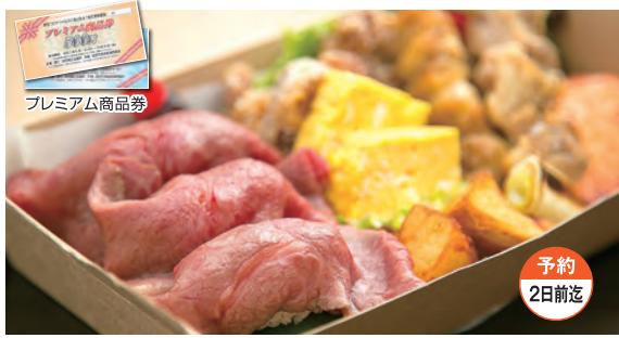
村上牛の握り弁当 1,620円(税込)

【住所】〒959-1371 加茂市数町8-11 【営業時間】17:30~0:00(L.O/23:30) 【休み】日曜日(祝日の場合は翌営業日)【駐車場】なし