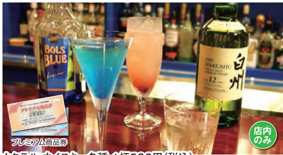
カクテル・ウイスキー各種 1杯500円(税込)~

【住所】〒959-1383 加茂市旭町1-11 【営業時間】20:00~2:00 【休み】不定休【駐車場】28台