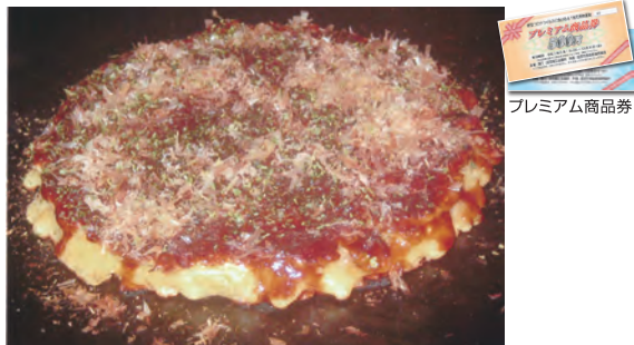
お好み焼き(ミックス) 680円(税込)