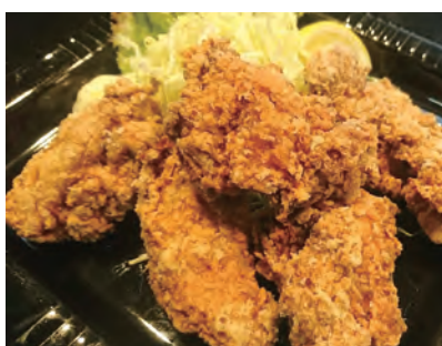
鶏ももから揚げ(5個) 530円(税込)