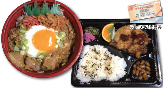
手作り日替わり弁当 各322円(税込)