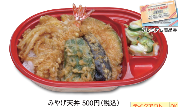
みやげ天丼 500円(税込)