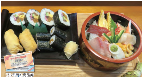
(右)生ちらし 1,400円(税込) 昼は出前のみ。夜は当日予約可。