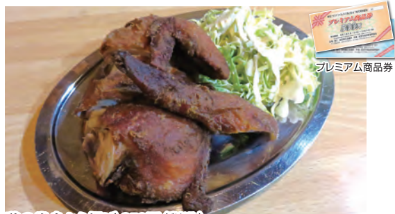
鶏の半身から揚げ 850円(税込)