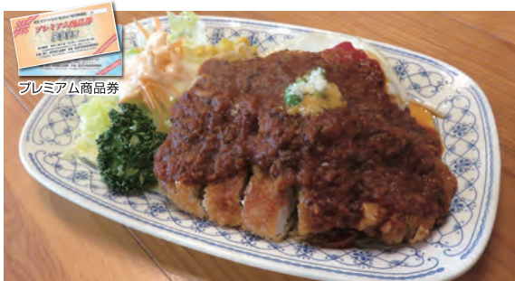
高原スパゲッティ 1,050円(税込)

【住所】〒959-1382 加茂市栄町11-21 【営業時間】10:00~20:00 【休み】火曜日【駐車場】5台