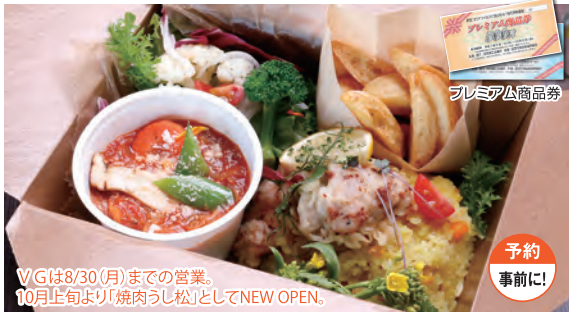
VGオリジナル洋風BENTO 1,000円(税込)

【住所】〒959-1381 加茂市新築町1916-1 【営業時間】11:00~15:00、17:00~23:00 【休み】火曜日【駐車場】30台