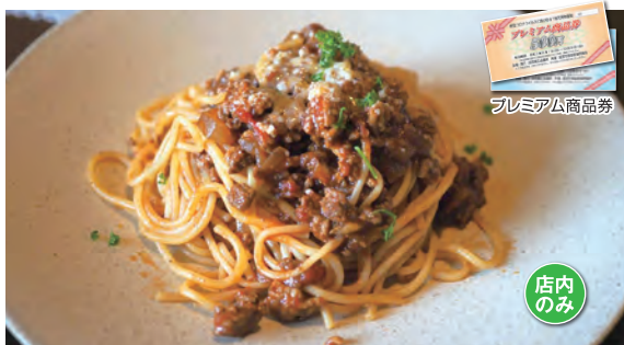
ミートソーススパゲティ 990円(税込)

【住所】〒959-1336 加茂市黒水856 【営業時間】11:30~16:30 ※土・日曜日は18:00まで 【休み】月・火曜日【駐車場】8台