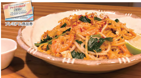
タイ風焼きそば 600円(税込)

【住所】〒959-1378 加茂市駅前3-12 【営業時間】17:00~0:00(休日の前日は2:00まで) 【休み】月曜日【駐車場】なし