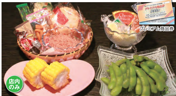
夏野菜セットチャージ 3,300円(税込)

【住所】〒959-1371 加茂市数町9-3-1 【営業時間】20:00~0:00 【休み】月曜日【駐車場】なし