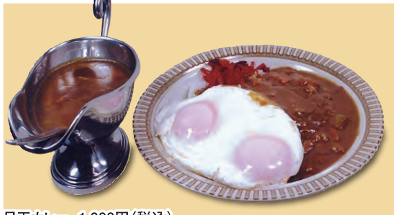
目玉カレー 1,000円(税込)