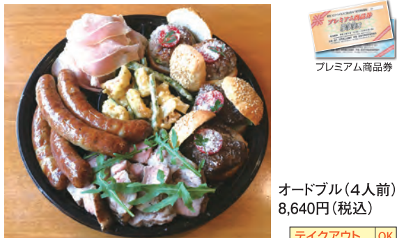
オードブル(4人前) 8,640円(税込)