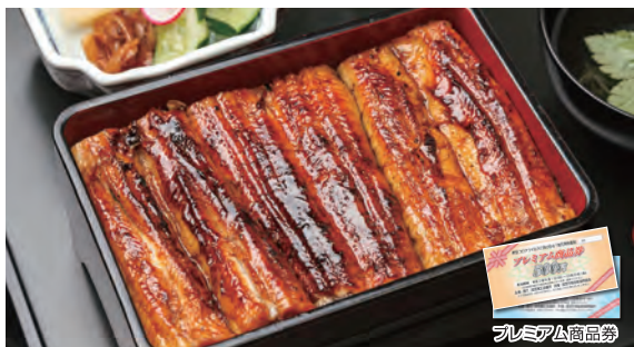
特上うな重 4,950円(税込)